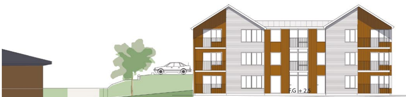
Fasad mot havet

Hyreslägenheter inflyttning sommaren 2011