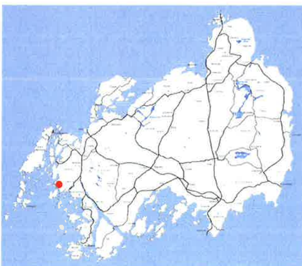
Planområdet söder om Stocken

Enevägens ekonomiska förening har 2014-04-10 inkommit med en ansökan om planbesked. Det har uppgivits att området redan från början bebyggdes med fritidsbostäder ej avsedda för korttidsuthyrning. Utskottet för Samhällsutveckling i Orust kommun beslutade den 3 september 2014 att i en detaljplan med enkelt för-