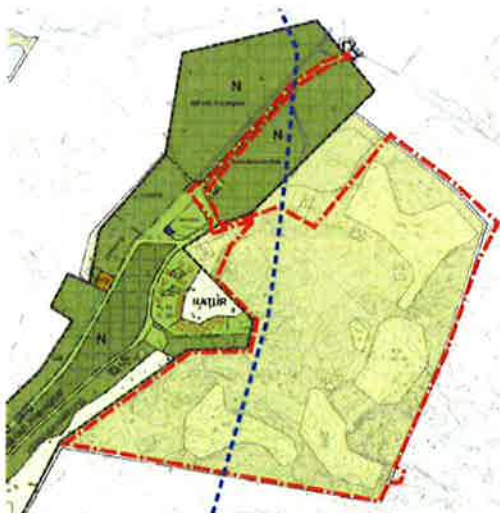
Utsnitt från gällande detaljplaner. Området väster om aktuell detaljplan är ersatt av en detaljplan för camping från 2010 (mörkare färg). Plangränsen för aktuell detaljplan visas i rött. Ungefärlig gräns för strandskydd i blått, se sid. 5.

För Orust kommun gäller Översiktsplan 2009 (antagen 2009-11-12). I översiktsplanen redovisas kommunens intentioner att uppdatera och komplettera föråldrade planer i Stocken. Utöver riktlinjer i översiktsplanen finns idag inga övriga specificerade kommunala intentioner framlagda, som innebär restriktioner för det idag rådande nyttjandet: fritidsbebyggelse.