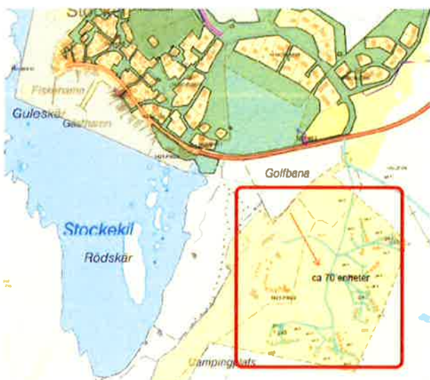
Översiktsskarta Orust med detaljplanelagd mark

farande enligt plan- och bygglagen 5 kap 7 pröva förutsättningarna för en användningsändring från camping till fritidsbebyggelse (dvs. bostäder) och att som skäl ange att planändringen syftar till att legalisera nuvarande markanvändning som är ändamålsenlig och hävdad.