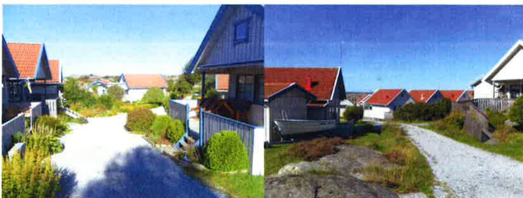
Miljö och bebyggelse inom planområdet