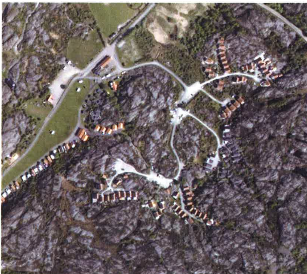
Flygfoto över planområdet