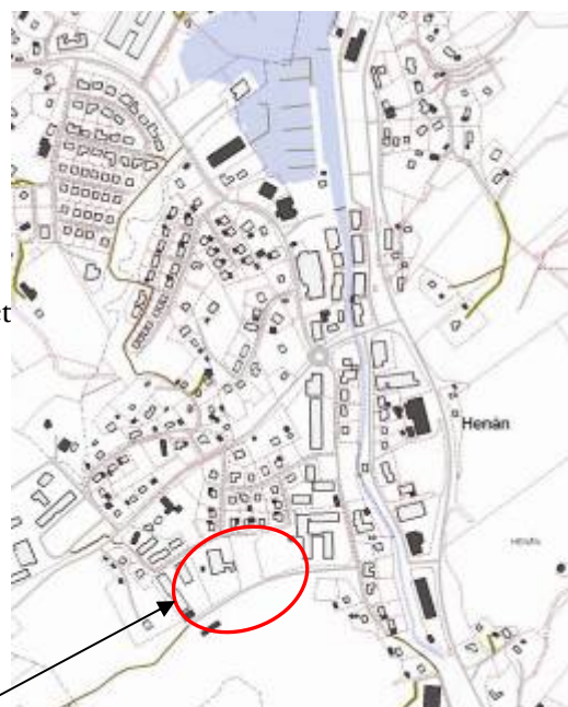
Planområdets läge i Henån

Merparten av marken inom planområdet är i kommunal ägo. Det gäller fastigheterna Henån 1:273, samt del av fastigheterna 1:275 och 1:306. Fastigheten Henån 1:272 ägs och förvaltas av Stiftelsen Orustbostäder.