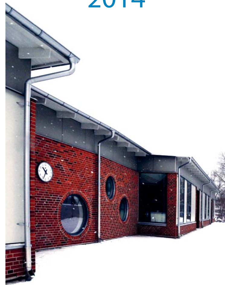
Till- och ombyggnad pågår av Ångås skola F-9 i Svanesund.