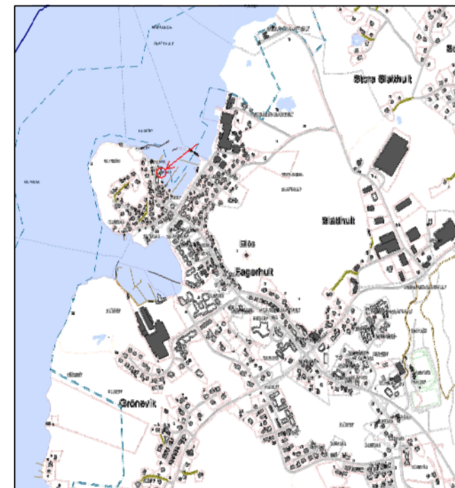
Planområdets läge i Ellös