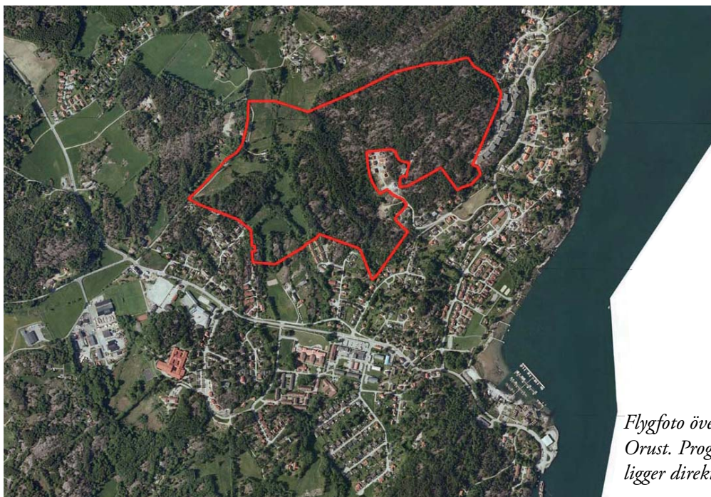
Flygfoto över Svanesunds samhälle på sydöstra Orust. Programområdet för Västra Änghagen ligger direkt norr om Svanesund centrum.