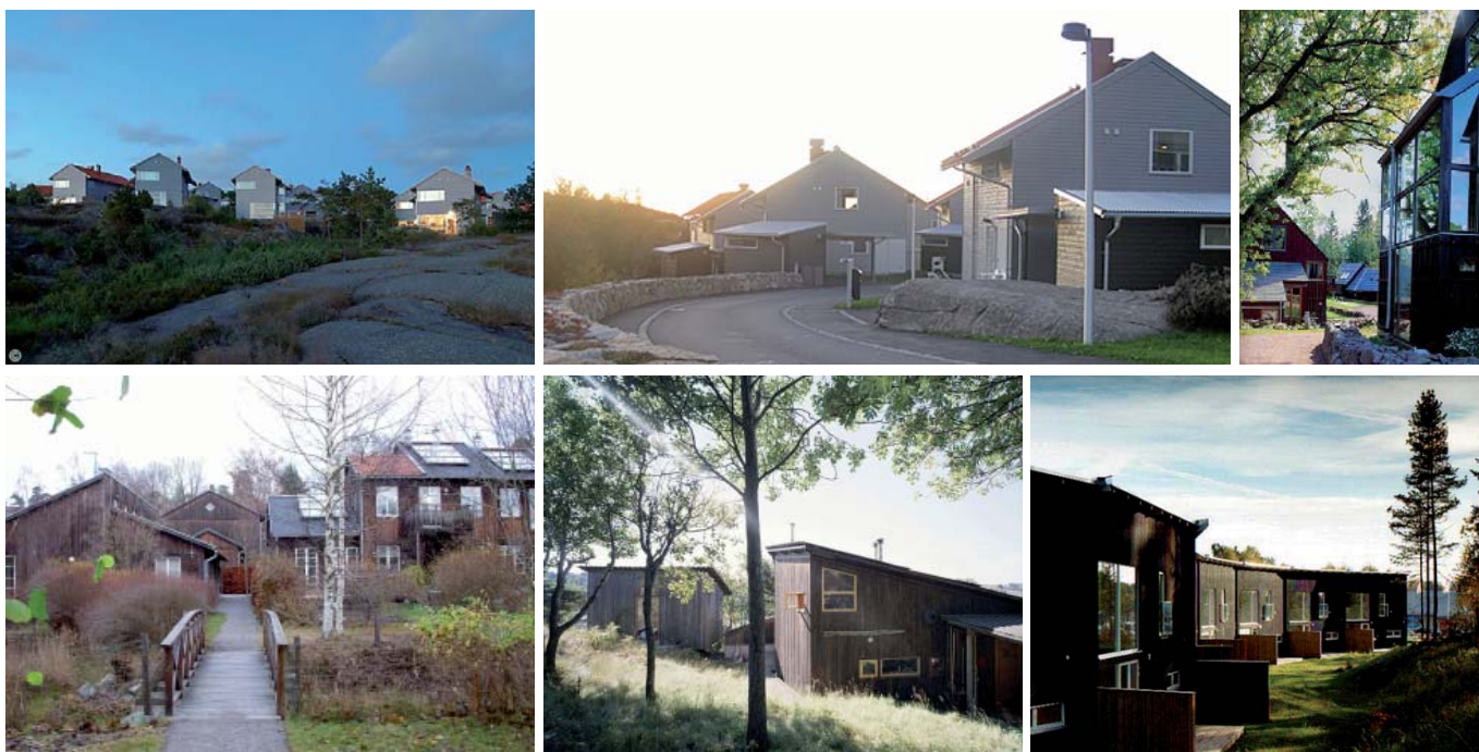
Exempel på naturanpassad bostadsbebyggelse. Höjdskillnader tas upp i socklar, detaljstuderade gatusträckningar och smala gaturum skapar en småskalig och trivsamt miljö. Befintliga träd och vegetation bevaras mellan husen. (Brf Valö fyr - Landström arkitekter; Hestra parkstad, kv Grieg - Niels Torp AS arkitekter; Understenshöjden - Bengt Bilén; Fritidshus Kebal - Landström arkitekter; kv Gulsporten - Malmström Edström Arkitekter)