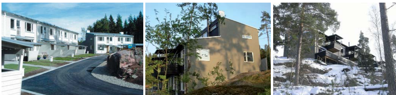
Exempel på sutterängradhus byggda runt en kulle. Placeringen skapar en social sida mot gården och på utsidan höga lägen med naturen alldeles inpå. (Vistaberg trädgårdsstad - Södergruppen arkitekter)