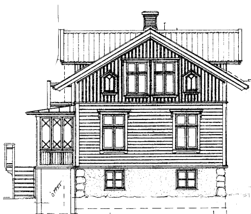
Fasad mot nordväst