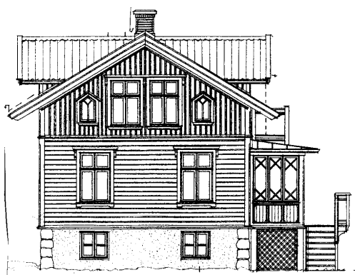
Fasad mot sydost