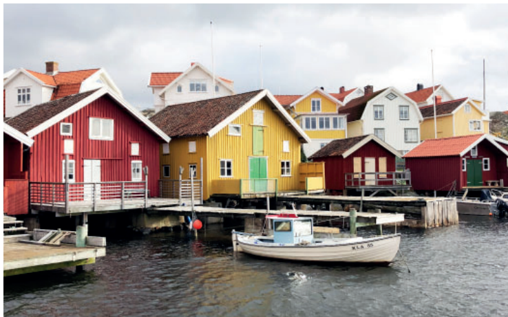
Sjöbodars i Hälleviksstrand.

Programsamrådet pågår till den 17 juni 2022. Läs mer på Detaljplaner under arbete på www.orust.se .