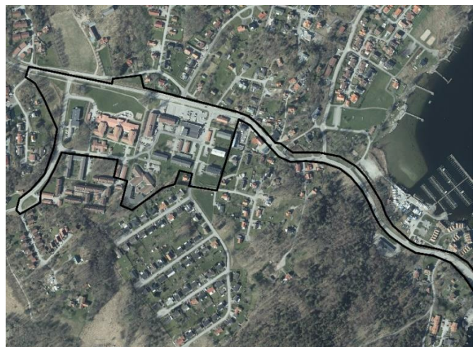
Figur 2 Ortofoto över planområdet