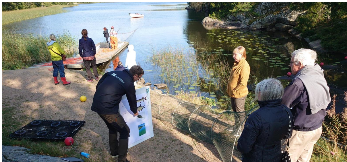
Reduktionsfiske i Grindsbyvattnet