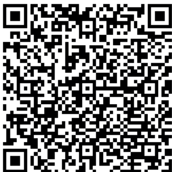
QR-kod till webbverktyget vi använder för tidig dialog.

Du kan skanna QR-koden i din smartphone för att komma direkt till webbverktyget. Öppna kameran på telefonen och fokusera på koden så hjälper din telefon dig.